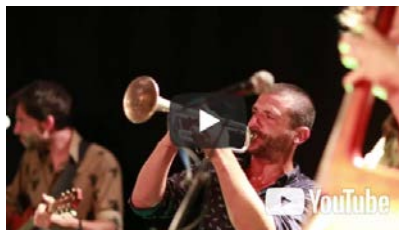
[LIVE] Kote'w Te Ye (Beken) Live @ Le Périscope