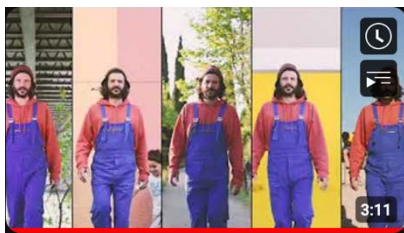
[CLIP] La Vie Vieux Negre (Trio Select cover)

Pour vos supports de communication, merci de privilégier les vidéos suivantes :