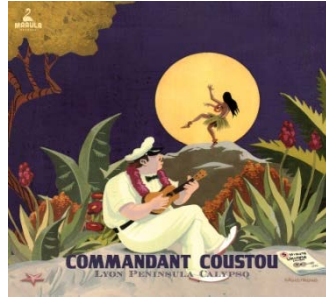
la réédition en 2019

Enregistrées fin 2014, les 9 pistes de l'album retranscrivent ce qui a poussé les musiciens vers ce répertoire et vers la scène : l'énergie paradoxale de cette musique toujours à mi-chemin entre la rage ou l'ironie des textes, et l'insouciance festive des instrumentaux.