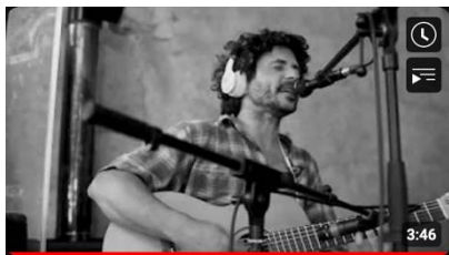
[STUDIO] Souternon Tapes - Amor Silvestre take 4